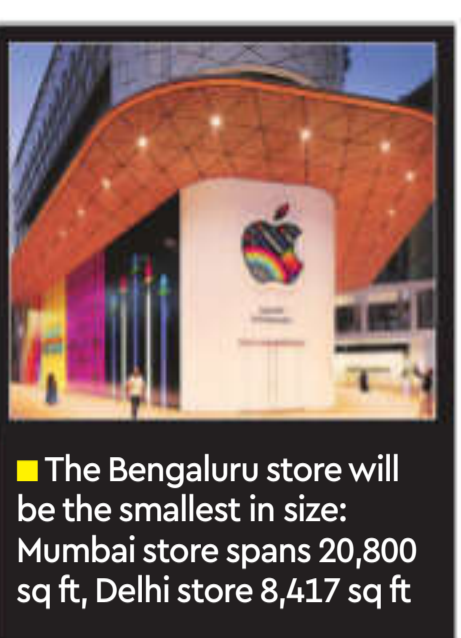
The Bengaluru store will be the smallest in size: Mumbai store spans 20,800 sq ft, Delhi store 8,417 sq ft

For its Bengaluru store, Apple will pay an annual rent of about ₹2.09 cr with a revenue share of about 2% for first three years. It currently has a store each in Mumbai and Delhi. Annually, the Mumbai store's rent works out to about ₹5.04 crore and the Delhi store's ₹4.8 crore.